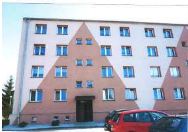
Widok z przeciwnej strony.