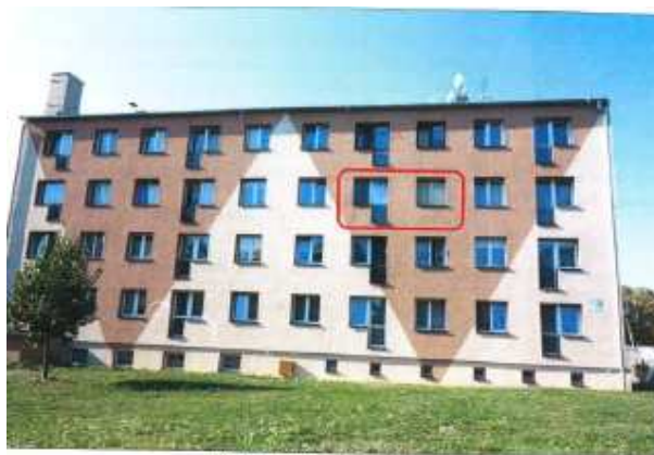
Widok budynku z ulicy Mostowej.

na sprzedaż lokalu mieszkalnego Nr 8, znajdującego się w budynku położonym w Lubaniu przy ul. Mostowej 4 wraz z udziałem we współwłasności nieruchomości gruntowej (działka nr 11/52, AM 5, Obręb IV o powierzchni 2.582 m 2 , JG1L/00021632/2).