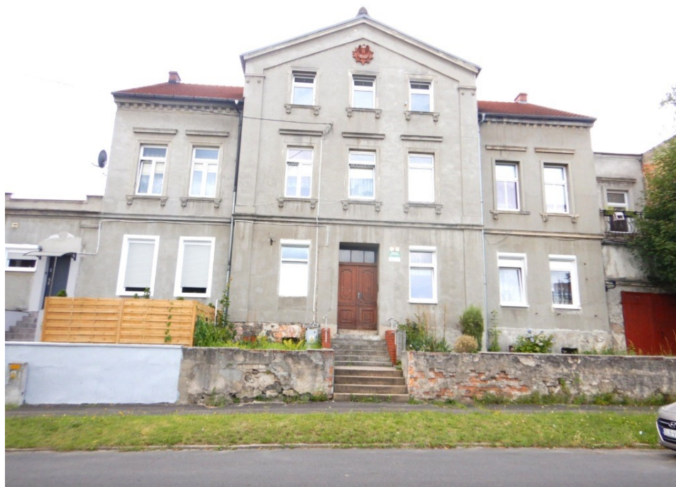
Ogólny widok budynku

na sprzedaż lokalu mieszkalnego Nr 6 znajdującego się w budynku położonym w Lubaniu przy ul. Górnej 2 wraz z udziałem we współwłasności nieruchomości gruntowej (działka nr 61, AM 6, Obręb V o powierzchni 245 m 2 , JG1L/00016048/3)